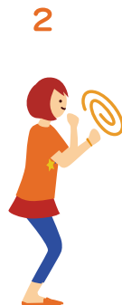
2 手をクルクルまわす