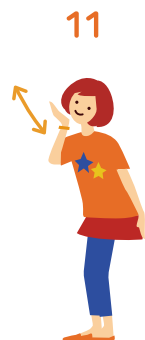
11 た 食べた 食べるポーズ (2回)