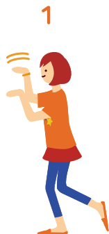
1 ぜんそう (前奏) 右をつんつんとつつく