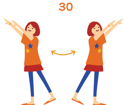
と キラキラ ヒカリが 飛んでいる 手をキラキラさせながら左から右へ大きく動かす。 手はだんだん高くしていく