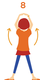
8 すがた うしろ姿も 後ろをむいて 両手を上に