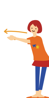
14 の ヒカリに乗ってやってくる 右→左の順番で両手をななめ前に つき出す(2回)