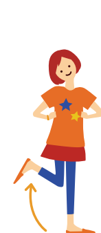
7 キレイだね そのまま右足を上げて 左足も上げる