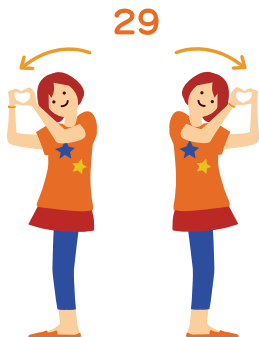
ゆめ 夢がある ハートをつかって左右 にかわいくポーズ