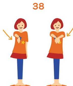
おおも 大盛り 右手→左手の順番で 両手を前に