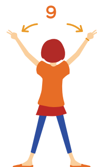
9 き 決まってる 手をピースにして 1,2,3と下げる