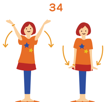
ステップも 両手を大きくまわして 「気をつけ」のポーズ