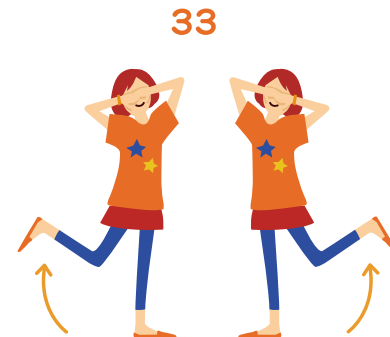
まぶしいね 目かくしポーズのまま左右の足を上げる