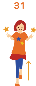
かんそう (間奏) 足踏みしながら 指パッチン