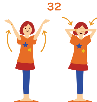
イエロー が 両手を大きくまわして 顔の前で目かくしする