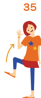
き 決まってる 右足と右手を同時に 上げておろす(2回)