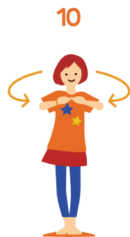
10 オムライス 前をむいて両手 を前に